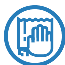
Toalla de papel