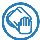
Paño de limpieza